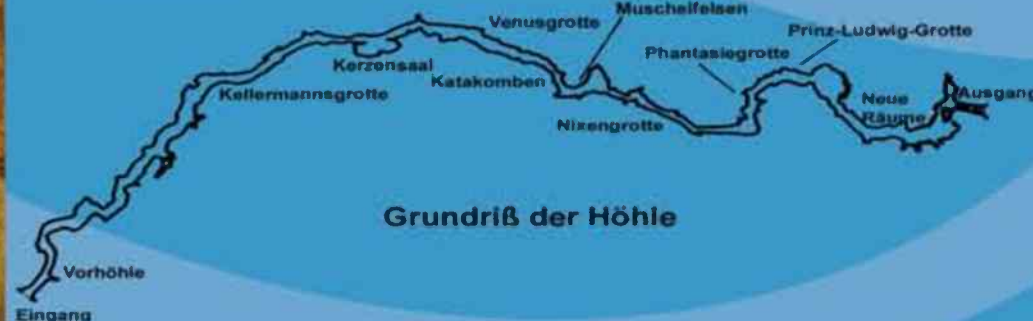
Grundriß der Höhle

Während der Wintermonate ist eine Besichtigung nach Voranmeldung bei der Touristinfo möglich.